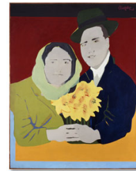
Los Suicidas del Sigsa, Beatriz González, 1965